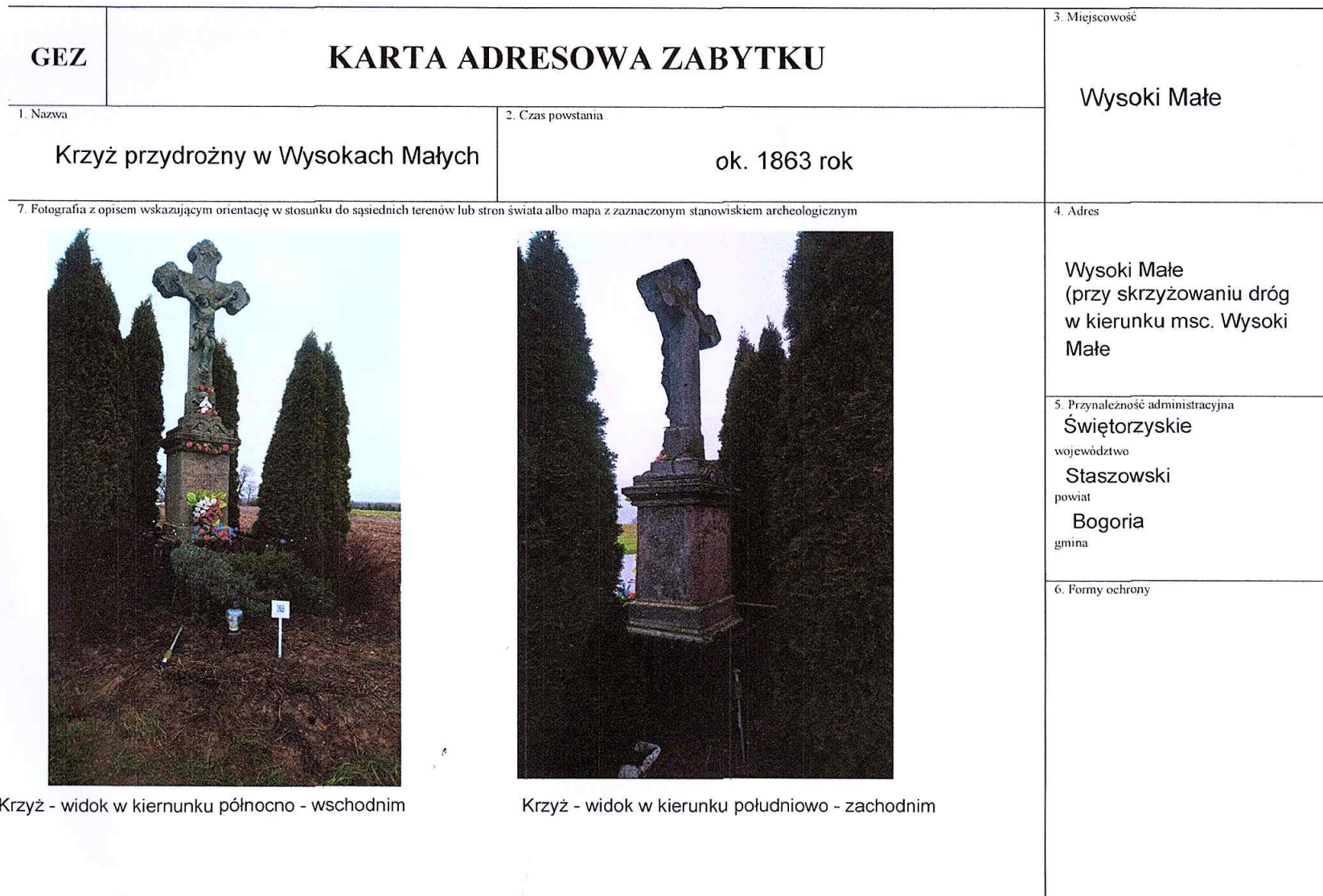
Krzyż - widok w kierunku północno - wschodnim